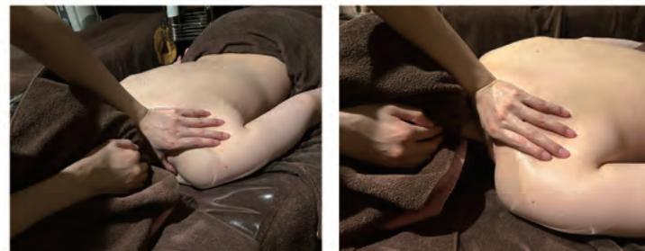
背中全体が温かく、ポカポカしてきました。