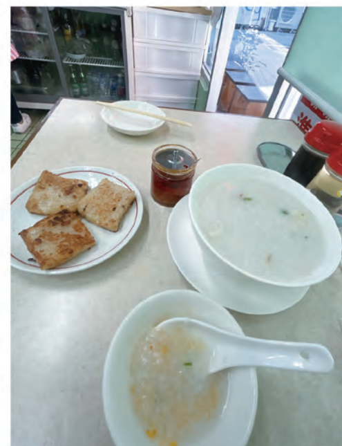
白粥と大根餅：自家製豆板醤でおいしさUP!