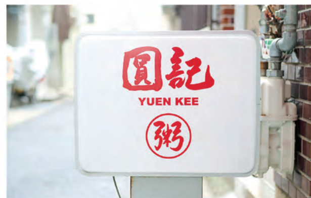
圓記看板：この看板が目印