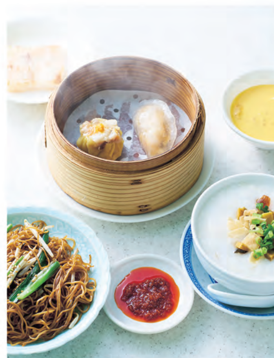
平日限定ランチ：平日30食限定のお得なランチもあります！