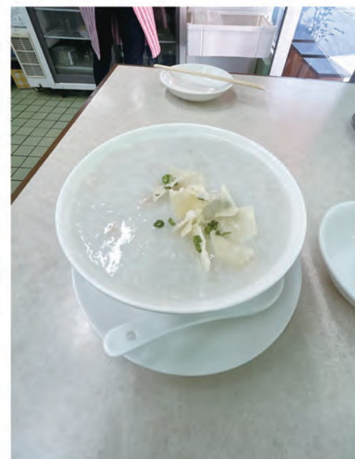
白粥：うまみ溢れる王道の中華粥!