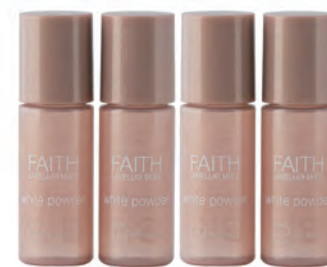
旧：ラメラモード ホワイトパウダー