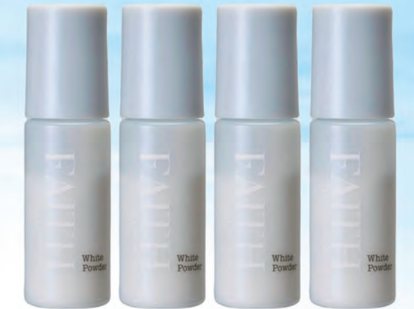
ラメラモード ホワイトパウダー

ビタミンCを閉じ込めたパウダーからエッセンス状になる美容液。気になるシミや、全体的なくすみにも効果的。毛穴の開きが気になる部分に使用すると毛穴を引き締め、ニキビ跡にも使え続けることで、肌をなめらかに。