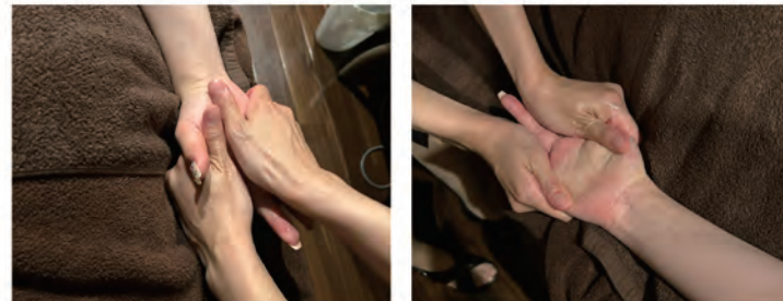
腕から指先までのマッサージも最高でした♪