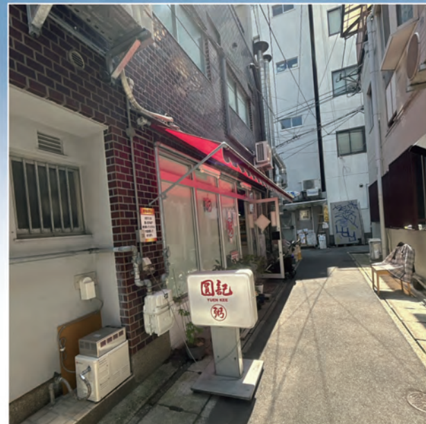
圓記：迷子になりそうな路地裏

南京町もいけれど、ローカルが愛する本格老舗中華もおすすめです！ ぜひ香港旅行の気分を味わえる『圓記』へ!!