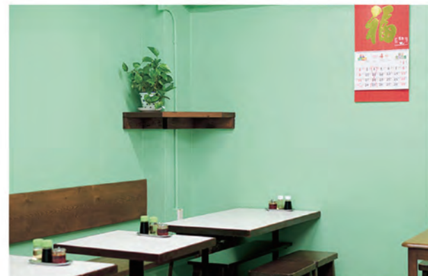
圓記_店内：香港レトロカフェなグリーン