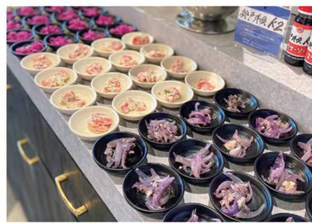
常時4種類以上ある惣菜