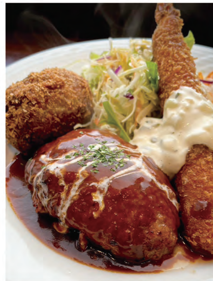
ハンバーグ+カニクリームコロッケ+海老フライ(サラダ・ライス付)の『エレガント(1,780円)』