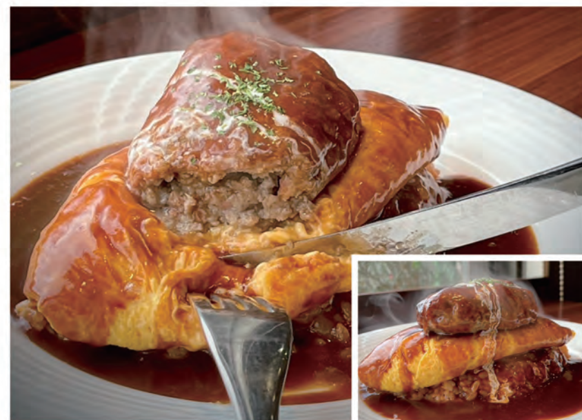
チキンライス+オムレツ+ハンバーグの『リッチ(1,700円)』

『リッチ』はフワフワのオムレツにジューシーなハンバーグとデミグラスソースがたまらなく美味しかったです!!