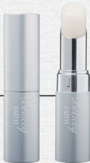
Belseeek リップベース 唇にうるおいを与え、艶やかに、とろけるようなテクスチャの無香料、無着色のリップクリームです。 ¥3,740 (税込)

お肌への有効成分がたっぷり、しっかり保湿成分がお肌に届く状態で配合されているベルシークのリップベースがぴったりです!! 驚くほど、リップがかわってきます!!