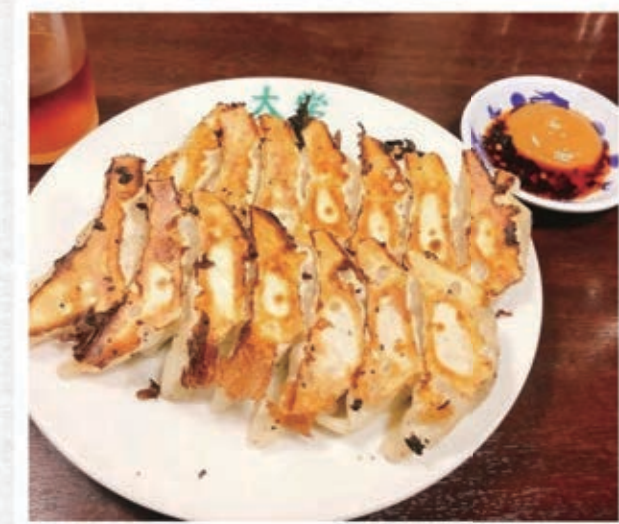
皮がバリバリの餃子！