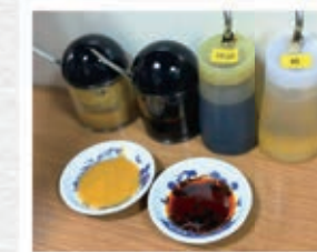
自分でタレを作るスタイル！